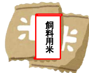
図2 用途を示した票せんを掲示 (食糧法遵守事項省令第3条)

※一括管理方式の場合は、飼料用米として特定された時点から他の米穀と区別して保管します。