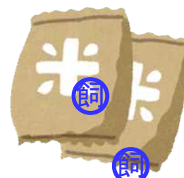
図3 包装に用途を表示 (食糧法遵守事項省令第4条)